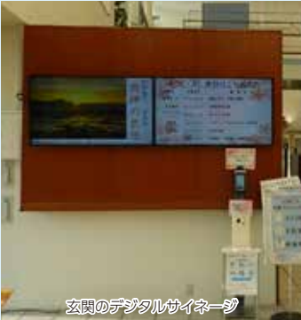
玄関のデジタルサイネージ

アピオスペースの玄関に入っすぐの正面にディスプレイが設置されました。二つのディスプレイが設置され、一台が組合会館のご利用案内表示、もう一台が告知等示はこれまでA4の紙で掲示しておりましたので、玄関廻りは随分とすっきりとした印象に変わりました。