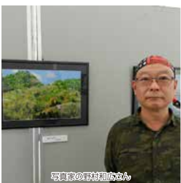
写真家の野村和広さん