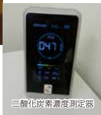
二酸化炭素濃度測定器