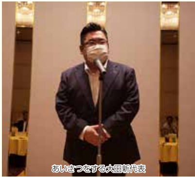
あいさつをする大田新代表