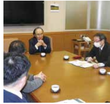
塚越会長からのお話し

い。モノより幸福感を重視する考え方がマッチして、就職希望者が増えているそうです。社員の給与は毎年必ず昇給を約束しており、給与を上げるために「みんなで頑張ろう」としているそうです。