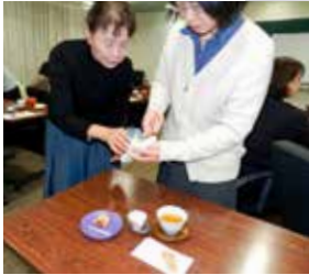
セミナー中の様子