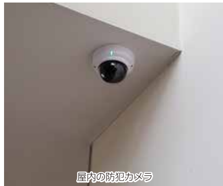
屋内の防犯カメラ