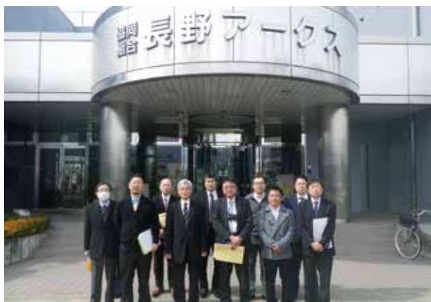
長野アークス玄関にて

他には、「開かれたアークス」を目指し、フォトコンテスト・夏休み自由研究・育種寺子屋塾などが開催されました。当組合にはない取り組みもあり、会津アピオの活性化につながるものがあれば、是非行ってみたいと思います。