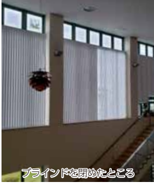
ブラインドを開めたところ