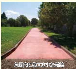
公園内に施工された舗装

(株)二丸屋山口商店様のご協力により行われていましたチャリティーソフトクリーム。そこで集められた善意の募金により、アピオスペース東側公園に舗装が施されました。