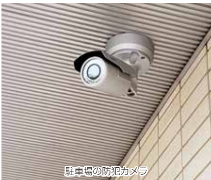
駐車場の防犯カメラ

アピオスペース館内及びアピオスペース駐車場に合計八台の防犯カメラが設置されました。これにより、犯罪の抑止効果があがるうえ、有事の際に入館者の足取りを追うことができるようになりました。