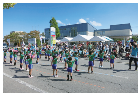
津アピオフィェスティバルを開催予定です。ご家族・ご近所さん、ご友人お誘いあわせの上、たくさんの方々のご来場をお待ちしております。

には①地域の勢力調査②当団地事業所、組合員の勢力他の調査③組合員施設と組合共同事業施設の実態調査と研究を中心に、今後の組合活動の活性化を目指した調査・研究を行います。