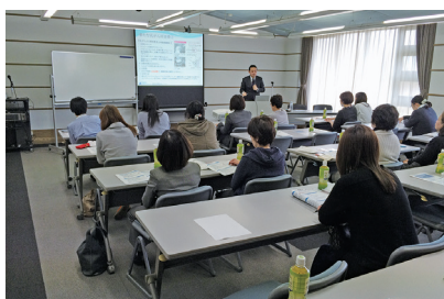
乳がんセミナーの様子

平成二十八年度も、福利厚生事業及び、企画委員会教育研修事業・未来創造事業委員会セミナー事業として、組合員の皆様にお役立ていただくセミナーの開催を行いました。