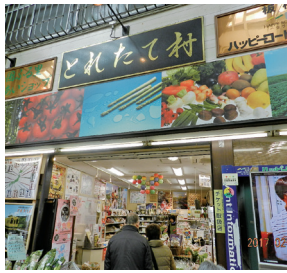
大山商店街のとれたて村