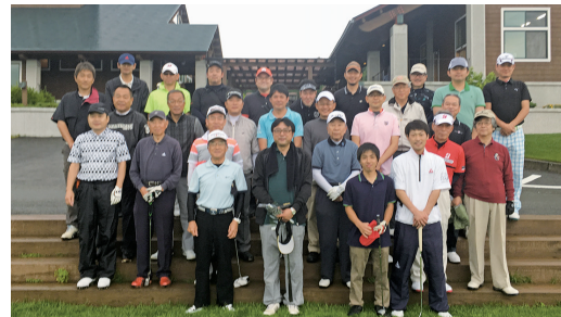
第30回記念大会 アピオクラブゴルフ愛好会

には①地域の勢力調査②当団地事業所、組合員の勢力他の調査③組合員施設と組合共同事業施設の実態調査と研究を中心に、今後の組合活動の活性化を目指した調査・研究を行います。