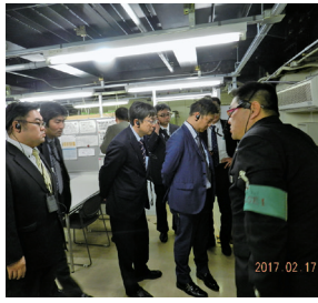
スタッフ控室を見学中の様子