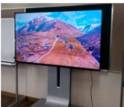
導入された4K対応70インチディスプレイ

本年も、社会保険労務士法人とのタイアップにより、働き方改革推進に関する組合員個別巡回指導を実施しました。五事業所が参加