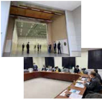
高崎卸商社街での視察の様子

この調査研究は一三名の専門委員で構成された専門委員会にて協議検討が重ねられました。先進地視察として高崎卸商社街協同組合を訪