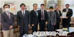
会津若松市長へ提出

最重要事項としての要望は市道町三一一三三八号(物流一号幹線(株)大和一様の南側二〇m幹線道路)の笈川街道までの拡幅延長整備です、これは団地創設以来、毎年要望しているものです。他に、団地内の交通環境等の改善要望を提出して参りました。