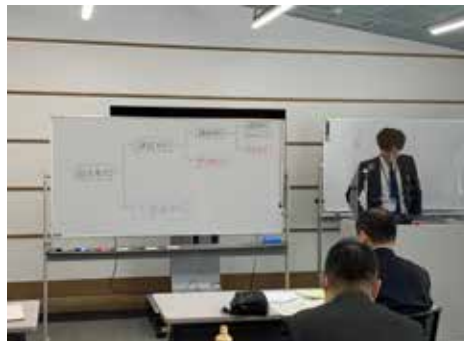
インボイスセミナーの様子

二〇二三年十月から消費税のインボイス制度(適格請求書等保存方式)が開始されるにあたって、本制度への対応について基礎からわかりやすく解説していただきました。