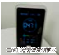
二酸化炭素濃度測定器