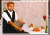
パントマイムショー ①11:00~ ②13:30~