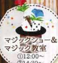
マジックショー&マジック教室 ①12:00~ ②14:30~