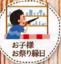
お子様お祭り縁日