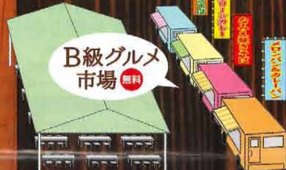
B級グルメ市場 無料